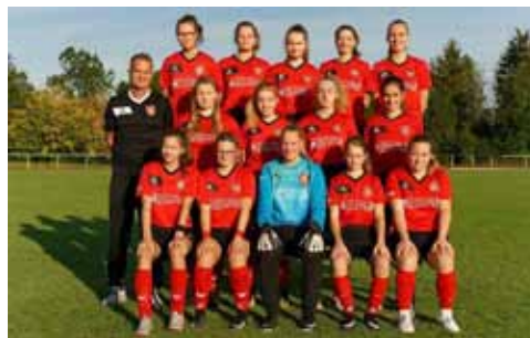
C1-Junioren Landesliga Staffel 1