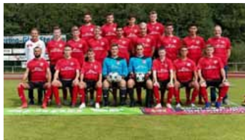
B1-Junioren Landesliga Staffel 1