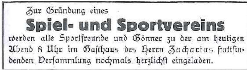
Zeitungsausschnitt zur Gründung 1920

Informationen zur Jubiläumsfeier vom Organisationsteam