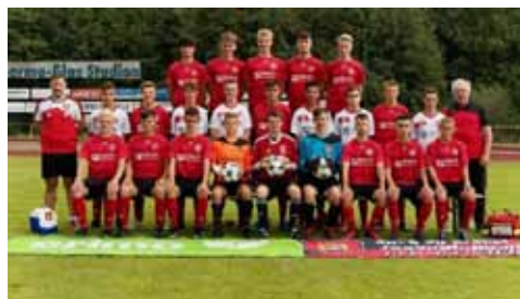
B1-Junioren Bezirksliga Staffel 2