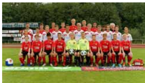
D1-Junioren Bezirksliga Staffel 3