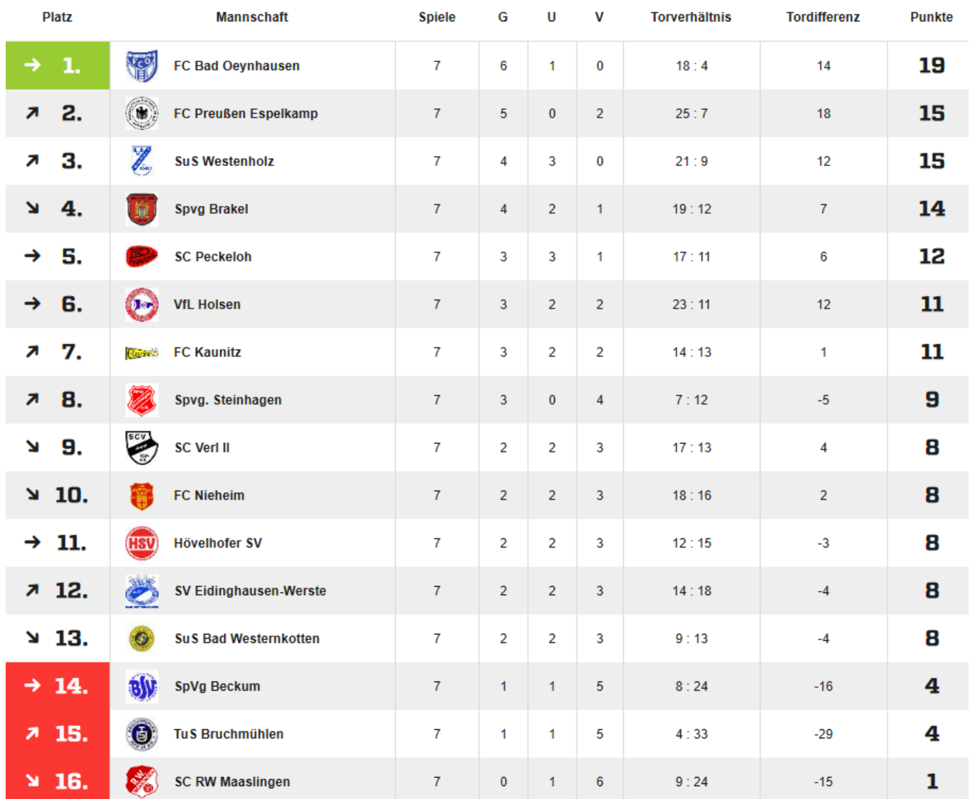
Tabelle Landesliga St. 1